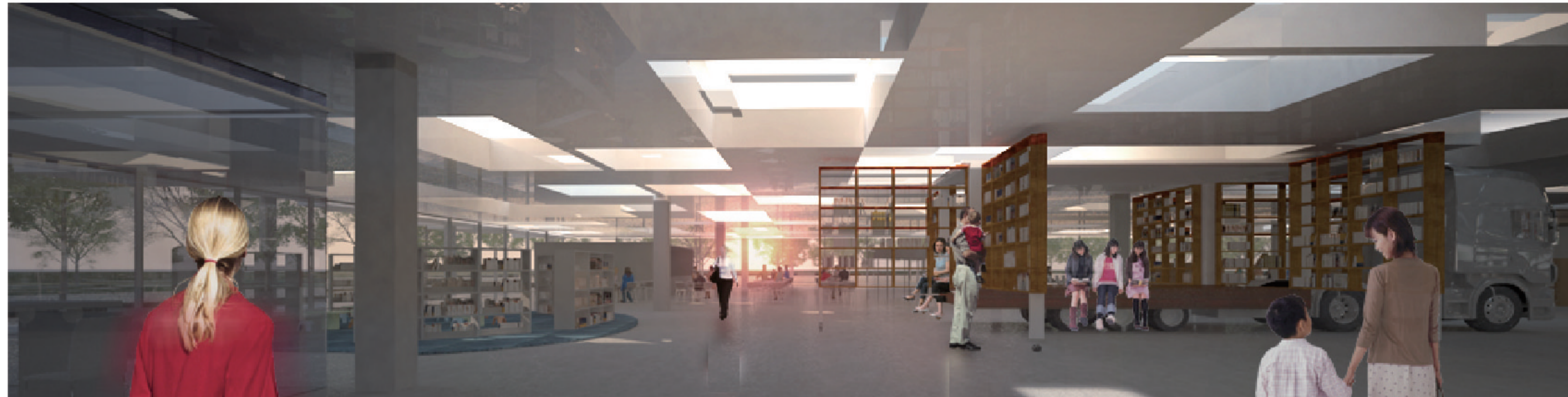
■ はじめに 陸前高田市の中心、賑わう市場と駅前図書館再建計画。駅前地区再開発の一環として実施される。