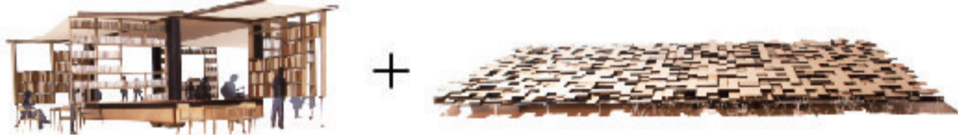
■ 背景 市場には多くの人が集まる賑わいの場がある。そんな中心から近郊の郊外にまで、読書の場を届けることが、市場の再建の目的の一つである。その目的を達成するためのテーマとして、市場の再建と市場の活性化を同時に実現すること、そして市場の再建の目的を達成するための読書の場を届けること、そして市場の再建の目的を達成するための読書の場を届けること。