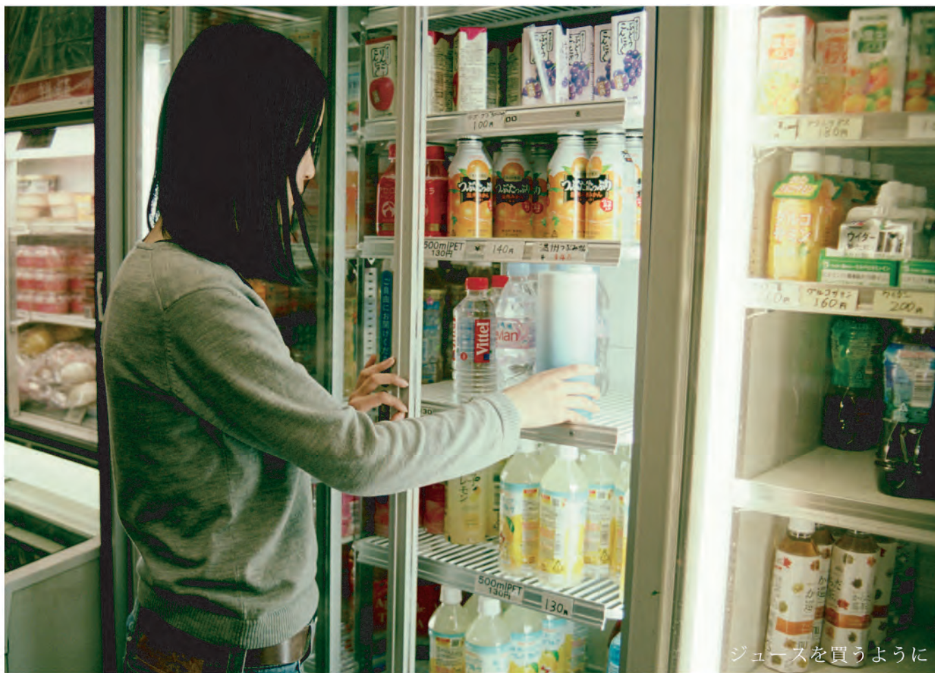
ジュースを買うように

コンビニで買って、どこにでも居場所を作るプロダクトの提案です。 ペットボトル型の容器の中には、くるくる巻きのビニールと魔法のキャンディ。 学校で習ったやさしい化学と、使う人の楽しいアクションがあいまって、 いろんなところでモクモク膨らむ楽しいプロダクトです。