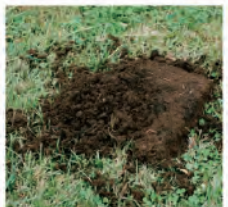
10. 土が柔らかってきたら、崩して地球にかえしましょう。