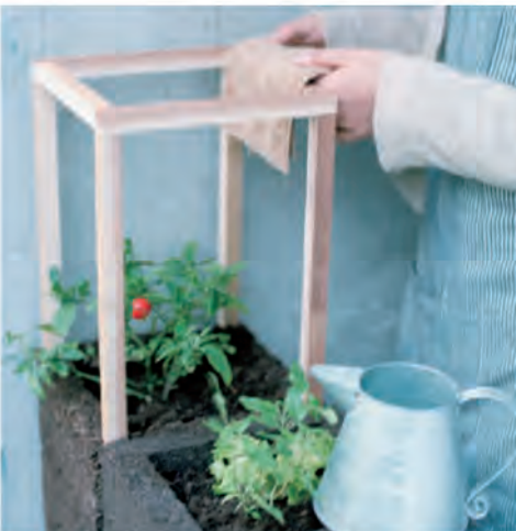
9. 二つ積むと、テーブルと同じくらいの高さになります。目の前に畑を見ながら新鮮な野菜を食べましょう。