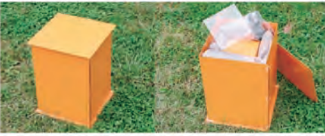
1. 箱の中身は軽量土、計量カップ、たたき棒です。