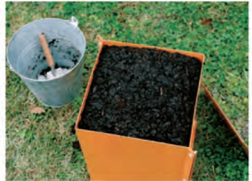
4. 箱の天面まで土を入れて、一日待ちます。