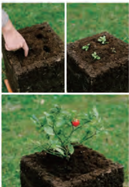
8. 表を参考にして野菜を育てましょう。