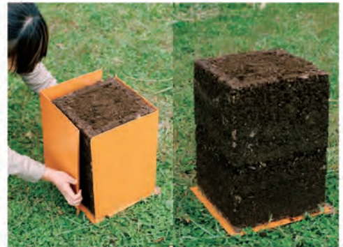
7. キットの外箱をはずして、3日ほど待ちます。