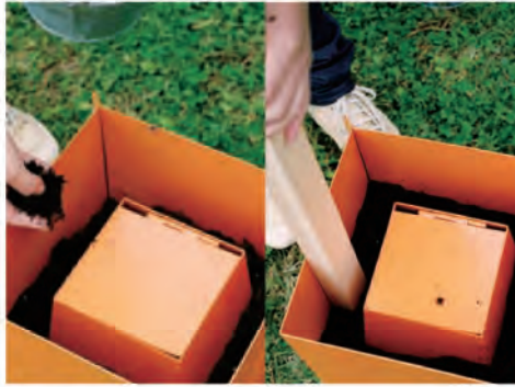
3. こねた土を箱の隙間に入れて、たたき棒でたたきます。