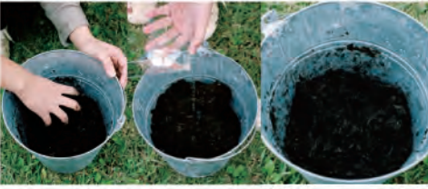
2. 水を入れて、土を混ぜましょう