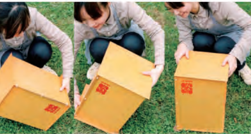
5. 上下逆さになるようにキットをひっくり返します。