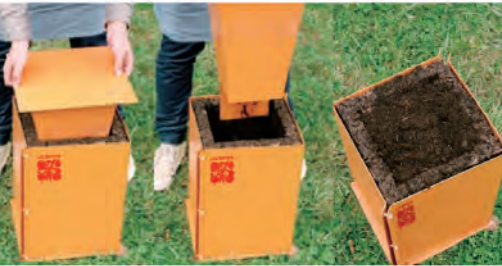
6. キットの中箱を抜きます。中から土が落ちてきます。