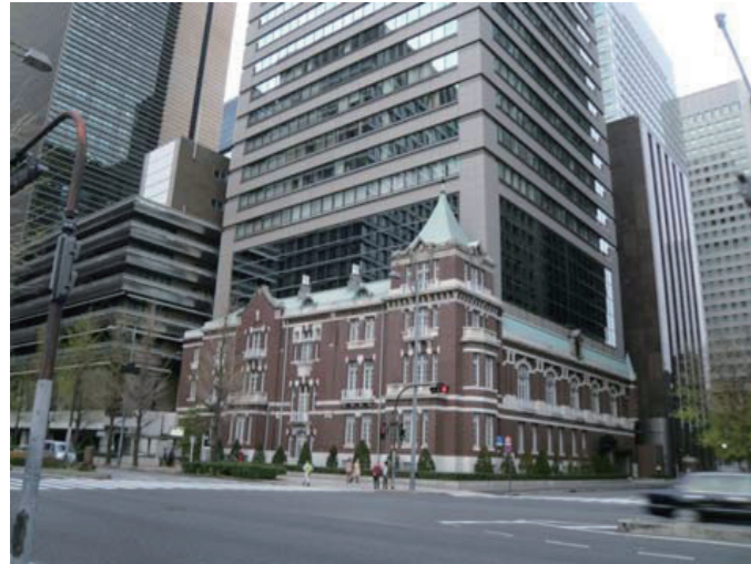
▲みずほ銀行前本店 銀行協会前通過