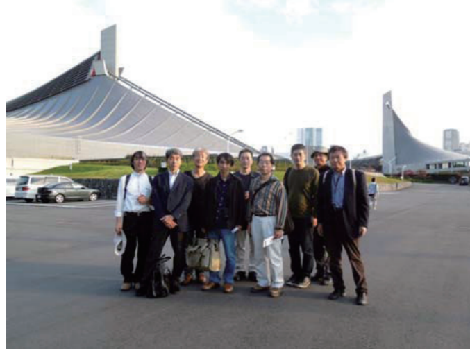
▲国立代々木体育館見学