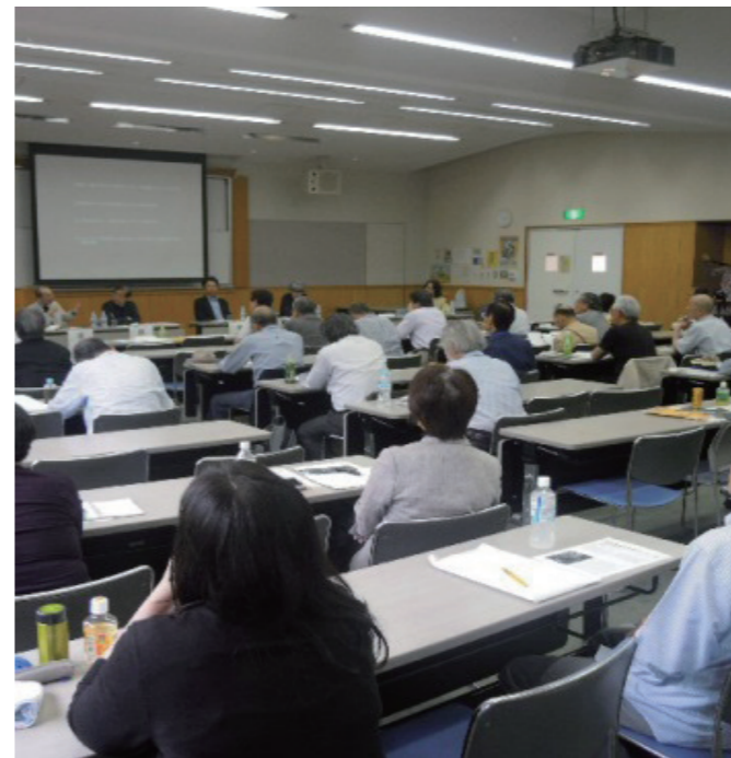
▲シンポジウムⅡ 未来へ伝える東京のアイデンティティ