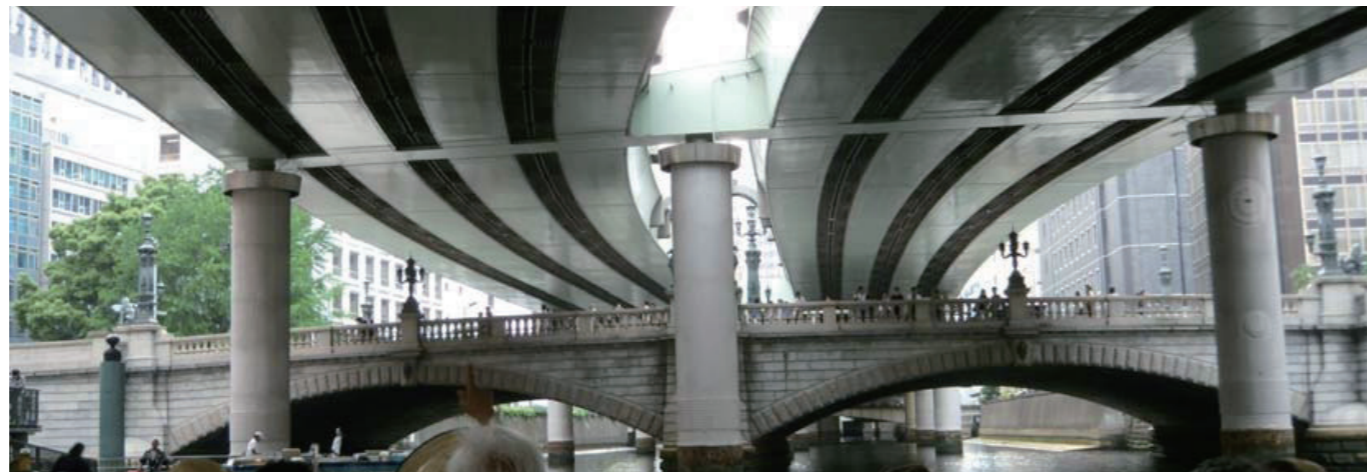
▲▼日本橋～神田川～隅田川クルーズ