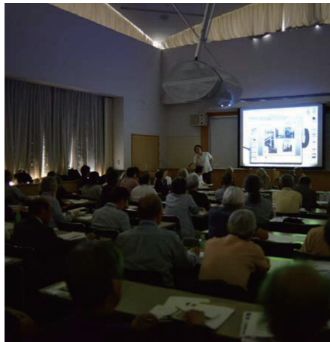
▲シンポジウムⅠ 東京14地域会発表