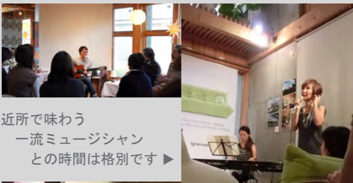
▲文化や芸術と普段着の日常の中でふれあう事で日々の暮らしが豊かに!!