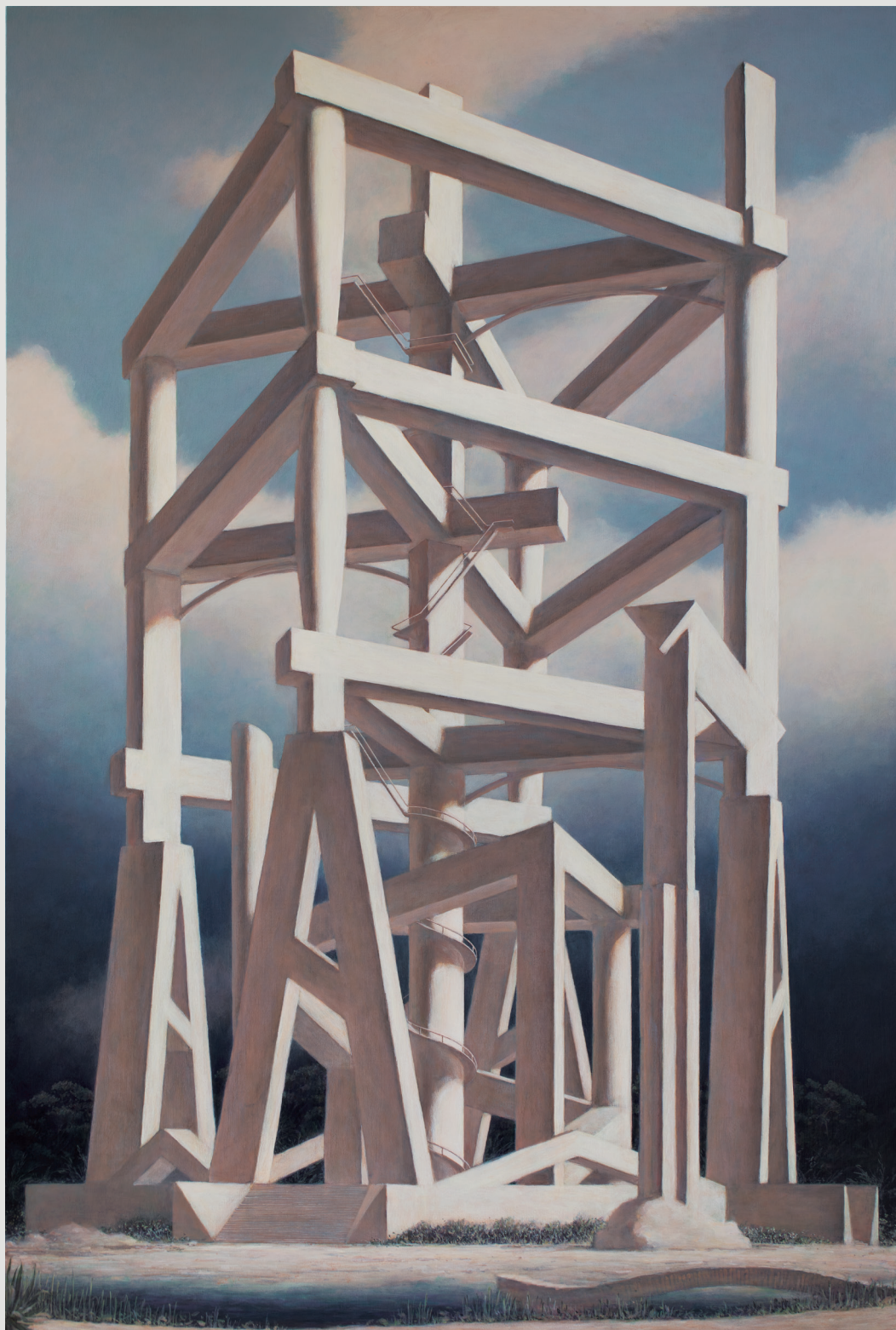
《Continuum-1》acrylic on canvas, 2023 © Minoru Nomata

画家は、なにを視ているのか？ 絵画は、なにを描くのか？ 記憶と対話して、筆は踊るのか？ 描かれた建築に宿る「リアル」とは、なにか？ 描かれた都市は、過去なのか、それとも、未来なのか？ 果たして、時間を描くことはできるのか？