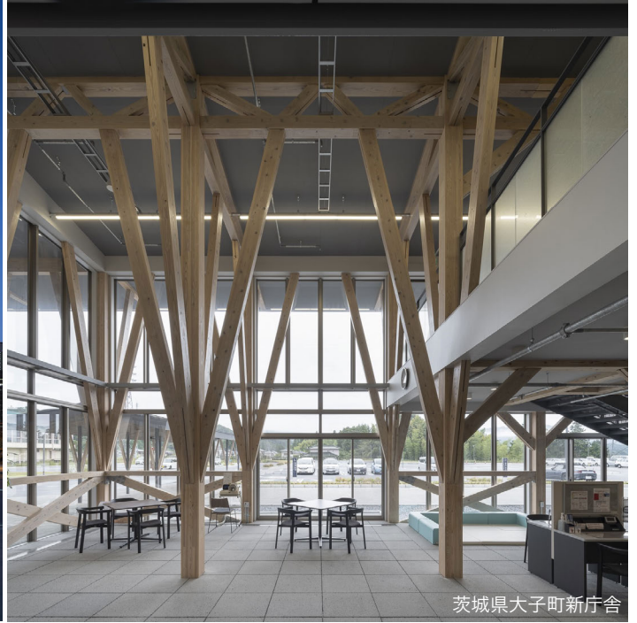
茨城県大子町新庁舎