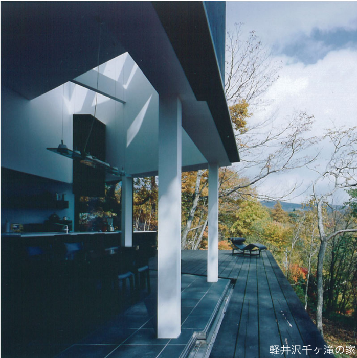
軽井沢千ヶ滝の家