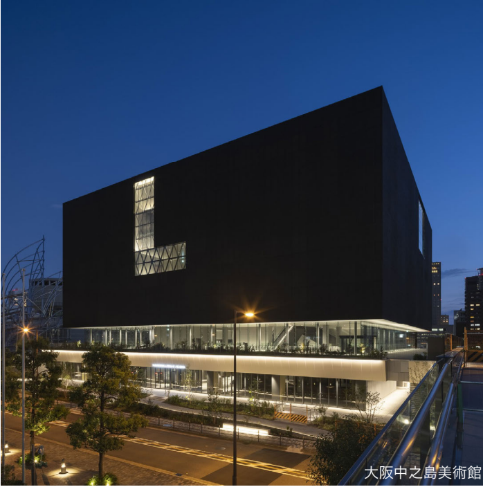
大阪中之島美術館

設計事務所を開設後、住宅や別荘の設計を中心に活動を展開してきました。その過程で、社会との接続を求め、積極的に設計コンペやプロポーザルへの参加を続けてきました。本トークイベントでは、学生時代の修士設計案や、若き頃にヨーロッパ各地の建築を見てまわった記録も交え、学生時代から今にいたるまでの建築家への歩みを、多面的な視点からお話ししたいと考えています。