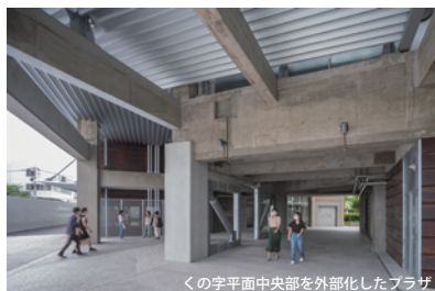
くの字平面中央部を外部化したブラザ