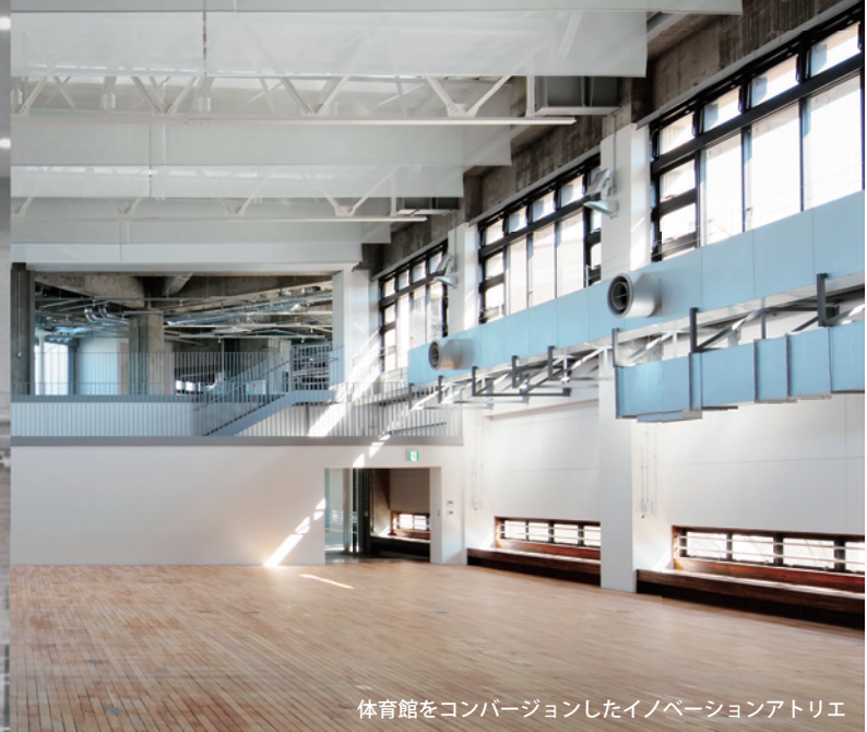
体育館をコンバージョンしたイノベーションアトリウム