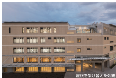
屋根を架け替えた外観