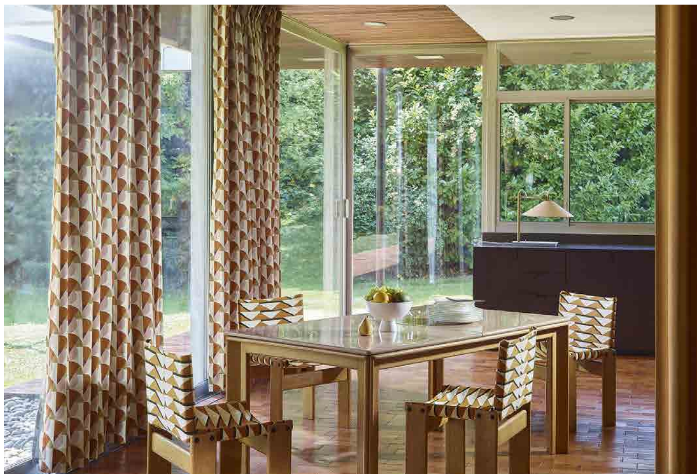
写真 デザイン名：MANILLE (マニラ)、MEXIQUE (メキシク)

フランスの名門ブランド PIERRE FREY (ピエール フレイ) が発表した、エリーズとジョー・ブルジョワの独創的な才能を称えたファブリックス『ELISE Collection Djo-Bourgeois (エリーズ コレクション ジョー・ブルジョワ)』(8 デザイン、25 点)の取り扱いを2月7日(火)より開始いたします。このコレクションは昨年ピエール フレイのアーカイブから、エリーズとジョー・ブルジョワのサインが入った1920～30年代のオリジナルドロ잉とキャンバスのセットが再発見されたことから企画されました。テキスタイルデザイナーのエリーズと建築家のジョー(ジョルジュ)は夫婦であり、仕事のパートナーとして「Djo-Bourgeois」の名で様々なモダニズム装飾を世に送り出してきましたが、今回はエリーズに焦点を当てたコレクションとなっています。これまで数枚のモノクロ写真でしか知られていなかった彼女のモダンデザインの作品が鮮やかに甦り、現在のインテリアにもマッチする魅力的なファブリックスコレクションとなりました。