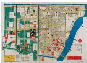
本所絵図 全