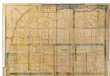
改正 深川之内小名木川ヨリ南方一円図 出典：国土地理院ウェブサイト