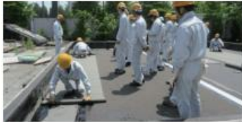
当組合の職業訓練実習(防水学校)

「防水」は、材料だけではなく、実際に使用する人が、その材料を理解し、適切に使用することが重要となります。日本アスファルト防水工業協同組合では、組合員への積極的な講習会を通じ、防水が適切に施工されるように努めています。