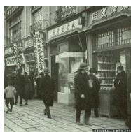
神保町古書店街の古今