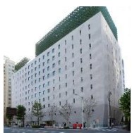
主婦の友社、小学館、集英社・・・