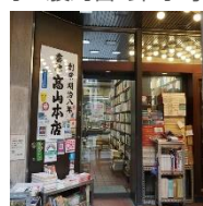
高山本店 入口、店内