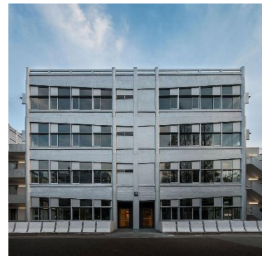
早稲田大学西早稲田キャンパス