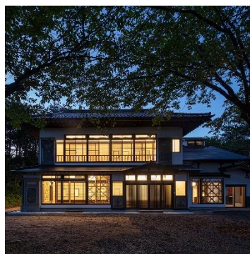
田野畑村 生きがいの館