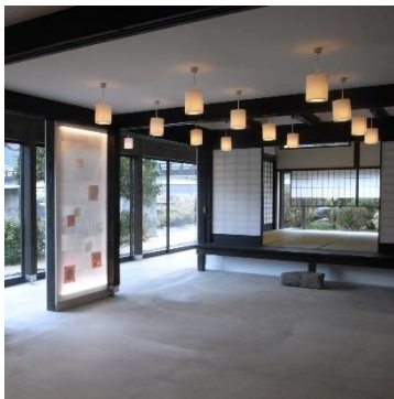
オーバービュー雲南