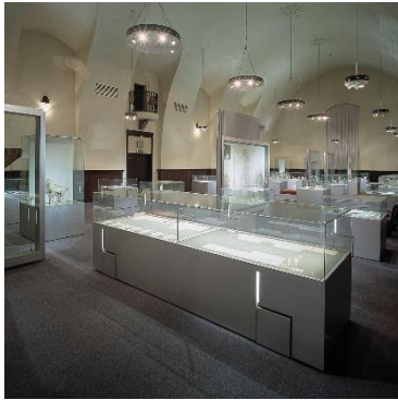
早稲田大学會津八一記念博物館