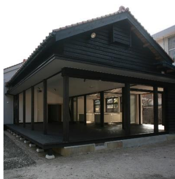
雲南市入間交流センター