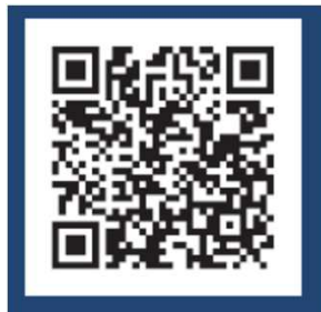
回答フォームQRコード