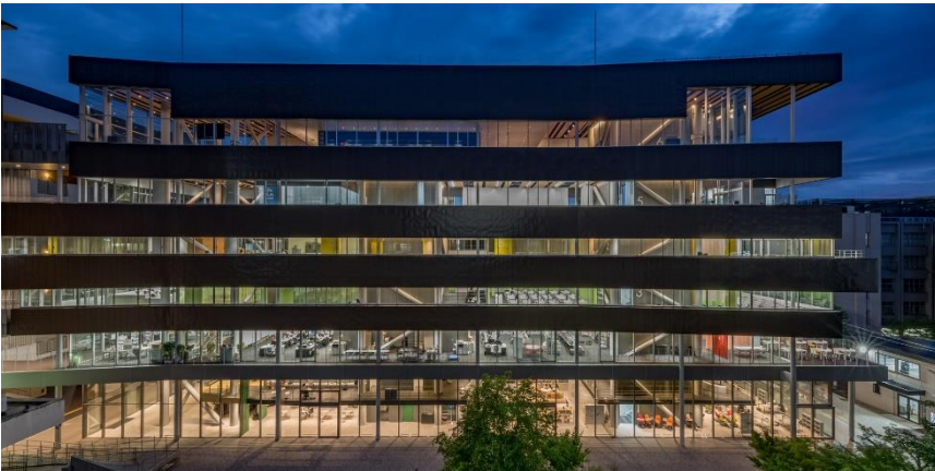
京都外国語大学新4号館 ©Daici Anō