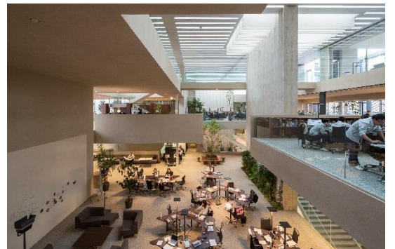
NICCA INNOVATION CENTER

ROKI Global Innovation Center –ROGIC – 昭和学園高等学校 南相馬市消防防災センター NICCA イノベーションセンター 梅光学院大学 The Learning Station CROSSLIGHT