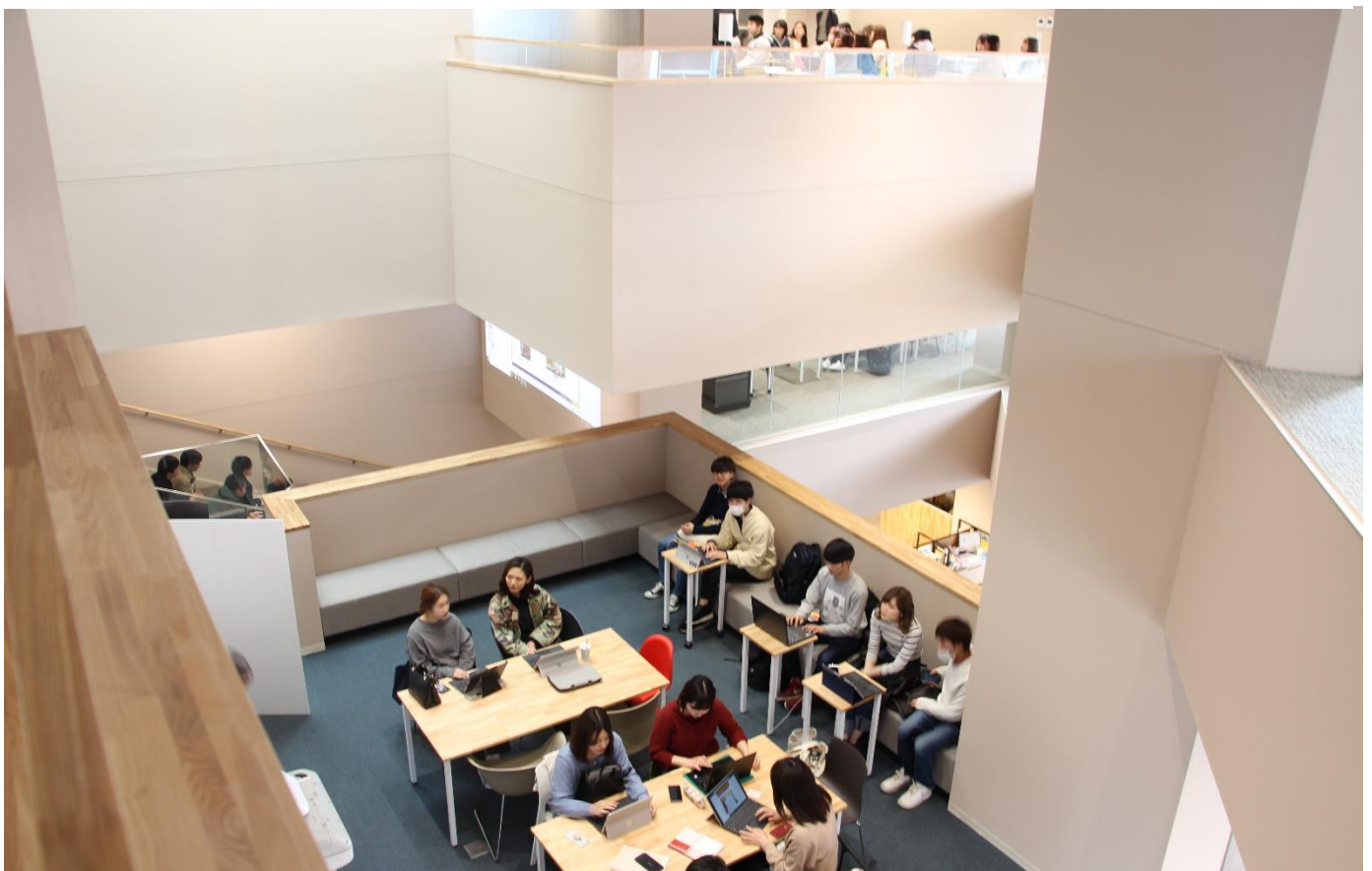
梅光学院大学「The Learning Station CROSSLITGHT」

環境とは、人間にとって大きな影響を与え続けるものです。そのなかでも、光や風、音は空間の中に漂いながら常に変化する、目に見えない空気みたいなもの。だからこそ、地域性や目に見えない環境要素をていねいにデザインすることで、人間の創造性を増幅させる力をもつような場になると考えています。最新作の梅光学院大学新校舎「The Learning Station CROSSLITGHT」を中心に創造と学びを誘発する空間について、また「ROKI Global Innovation Center -ROGIC-」(2013 年)と「NICCA INNOVATION CENTER」(2013 年)を通して考えたことや、日頃から考えていることをお話ししたいと思います。