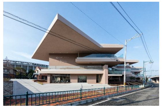
梅光学院大学「The Learning Station CROSSLIGHT」

2019年 JIA 日本建築大賞 2018年 中部建築賞 2017年 日本建築学会賞、JIA日本建築大賞 2015年 BCS(日本建設業連合会)賞、中部建築賞、 日事連建築賞「国土交通大臣賞」、 AACA(日本建築美術工芸協会)賞優秀賞 他多数受賞