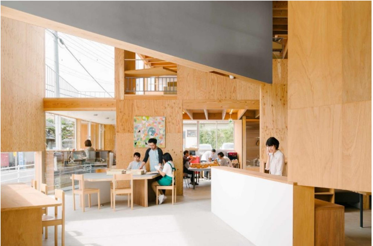
Good Job! Center KASHIBA

Good Job! Center KASHIBA は、障害のある人とともに、アート・デザイン・ビジネスの分野をこえ、社会に新しい仕事をつくりだすことを目指しています。一人ひとりの表現の豊かさのように、はたらき方もまた多様であるはず。明るく天井の高い場所や、薄暗く落ち着いた場所、地域に開かれた場所など、障害のある人もない人も、地元の方も遠方からの来訪者も、それぞれに居心地の良い場所を見つけることが出来る場として構想されました。[大西麻貴]