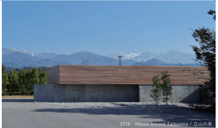
2016 House toward Tateyama / 立山の家