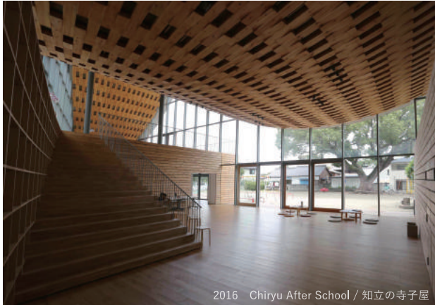
2016 Chiryu After School / 知立の寺子屋