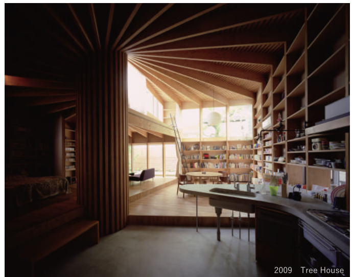
2009 Tree House