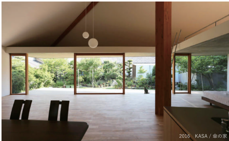
2016 KASA / 傘の家