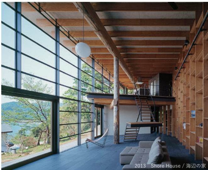
2013 Shore House / 海辺の家