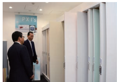
塗装の見本も大きなサイズで見ることができます

東京・大田区の関西ペイント販売本社には、新しい塗料の紹介や色の提案ができる「PAINT GALLERY」があります。100インチの大型プロジェク