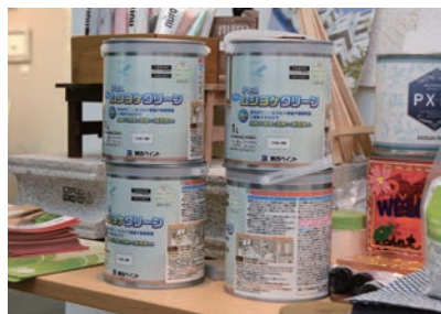
虫除け塗料「アレスムシヨケクリーン」 ホームセンターでもご購入いただけます

また、「アレスムシヨケクリーン」は、室内のビニールクロスや塗装壁面に塗装することができる虫除け塗料です。近年、デング熱やジカ熱など蚊が媒介する感染症が国際的な問題になりまし