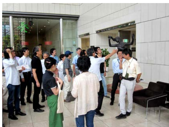
東京芸術劇場 2 階シーティングスペース