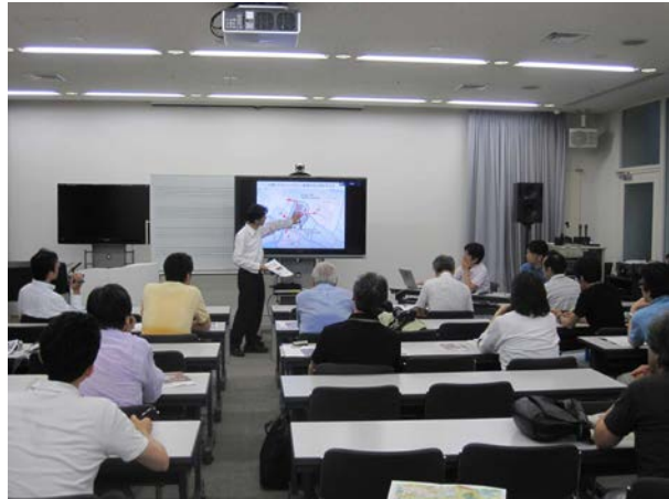
↑ 東京音楽大学 100 周年記念本館 計画説明