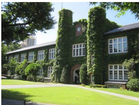
←立教大学 1 号館 耐震改修