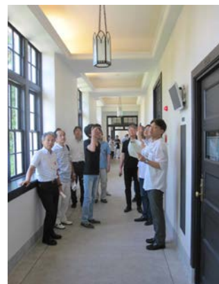
1 号館 耐震改修 廊下→