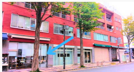
会場「アーキシップスタジオ」