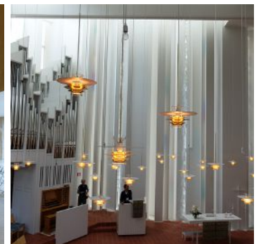
グッドシェパード教会 | J. レイヴィスカ