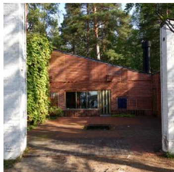
夏の家 | A. アールト