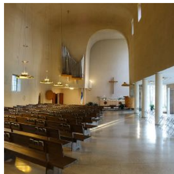
復活の礼拝堂 | E. ブリュッグマン