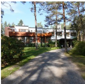
マイレア邸 | A. アールト