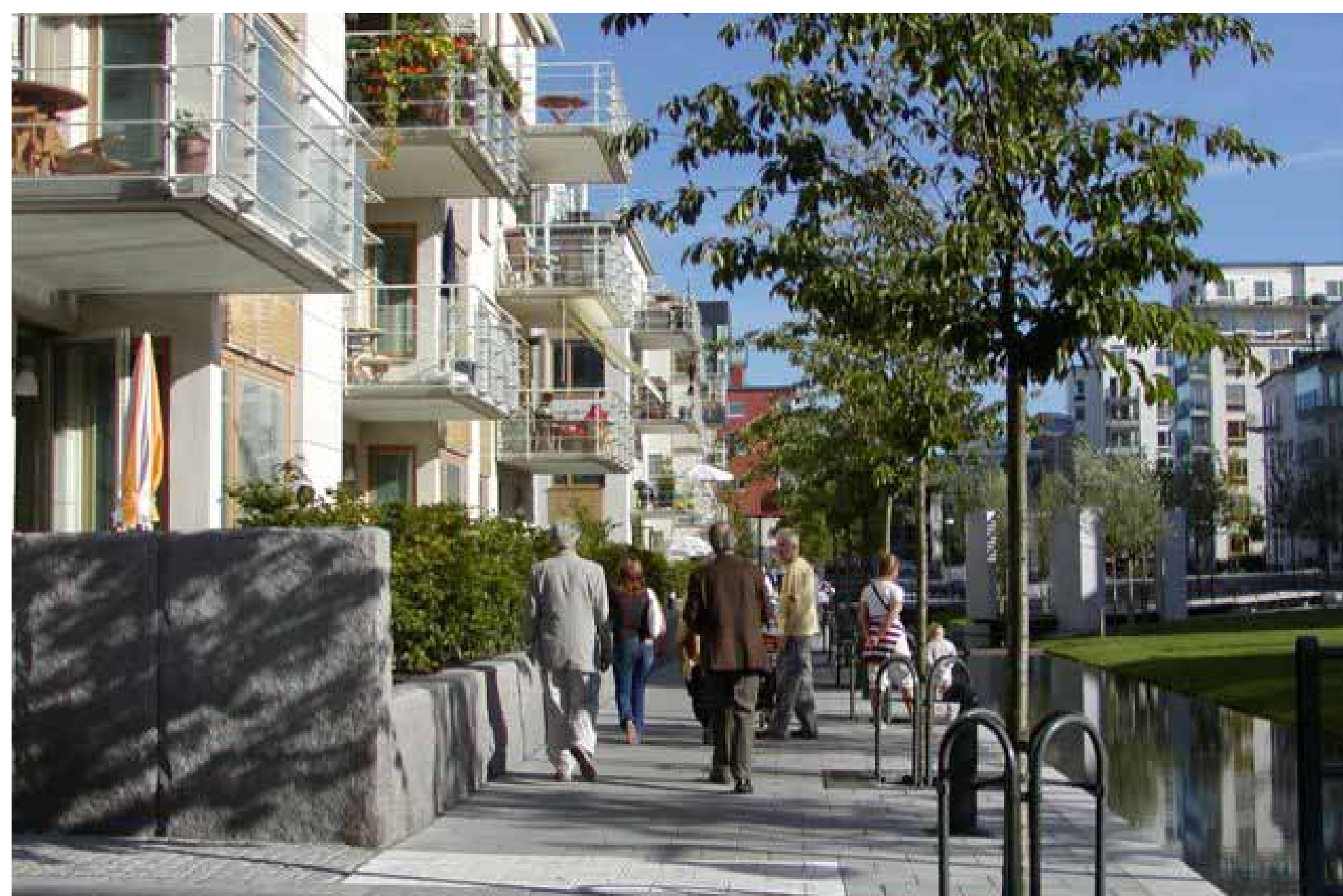
メインストリートの水路と緑の広場はこの街の自慢の空間になっている The pride of the neighborhood is the canal along the main street and the plaza filled with greenery.