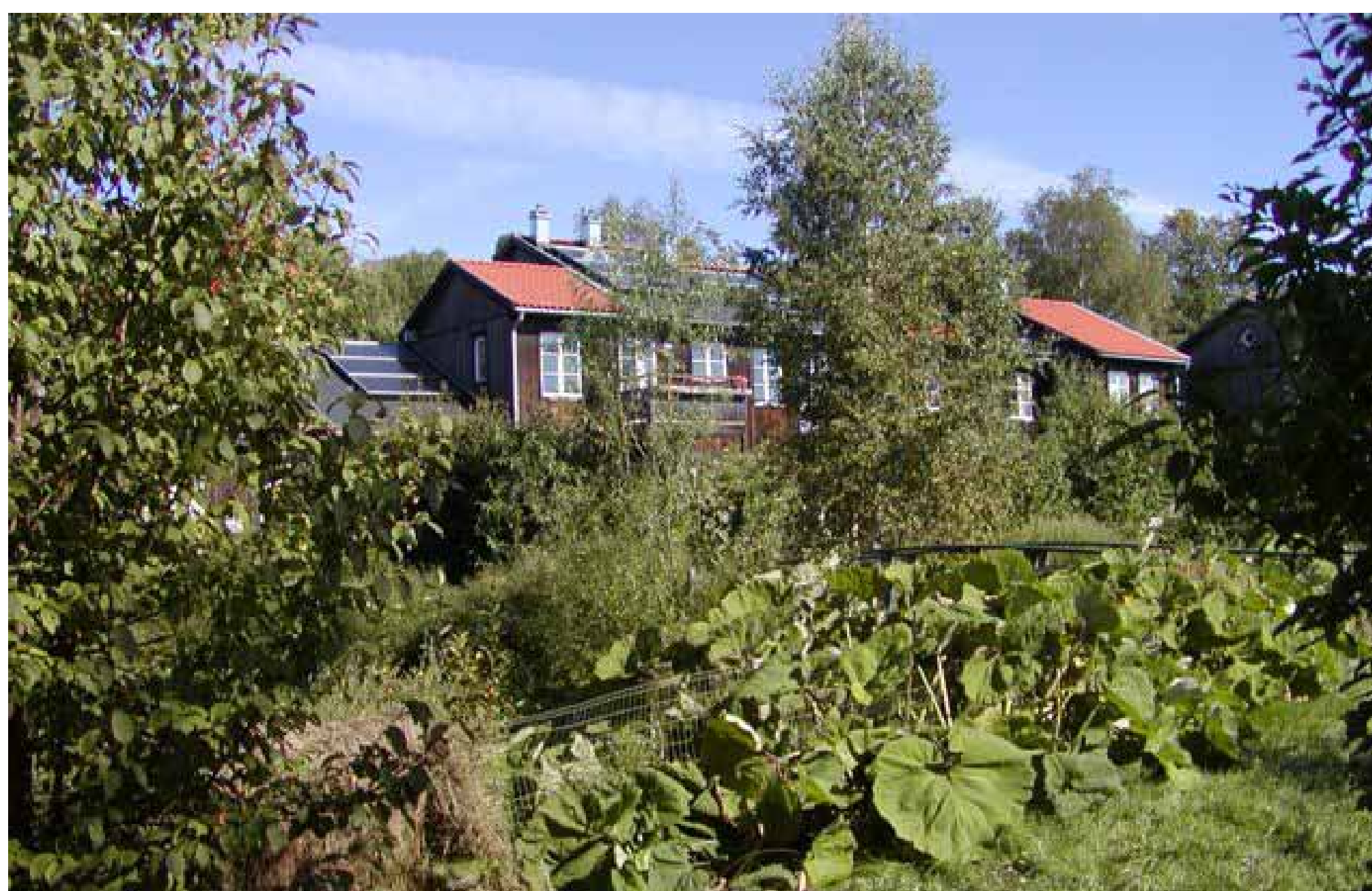
住戸の屋根にはソーラーパネル、住戸の手前には菜園とビオトープがある Units have solar panels on the roof, vegetable gardens and biotopes in front.