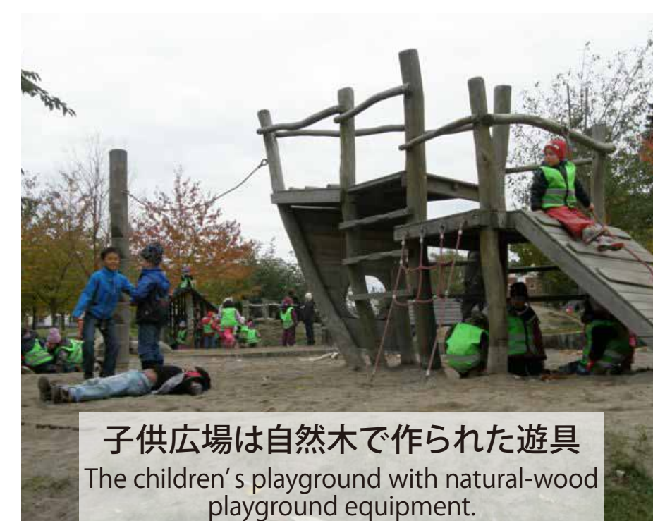
子供広場は自然木で作られた遊具 The children's playground with natural-wood playground equipment.