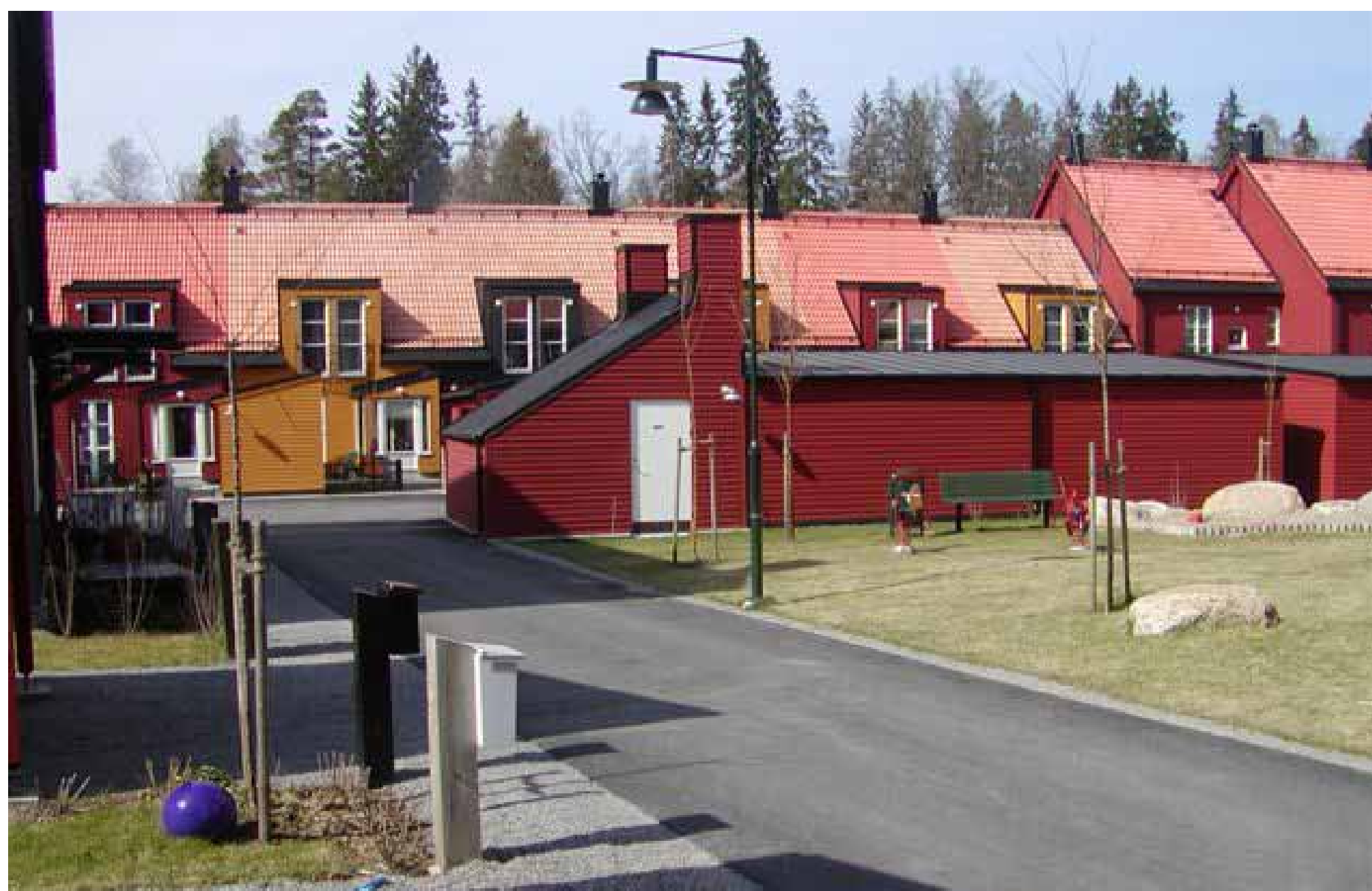
二階建て住戸の前にランドリーと車庫があり、その手前は子供広場になっている The front part of the 2-storey residence holds a laundry room and garage. In front is a children's play area.