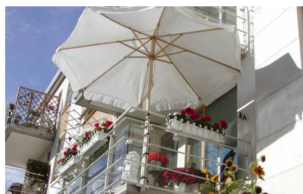
個室のバルコニーは花で飾られ、子供は素足でも散歩出来る Flowers decorating the balcony of a private room, children happily walking barefoot.