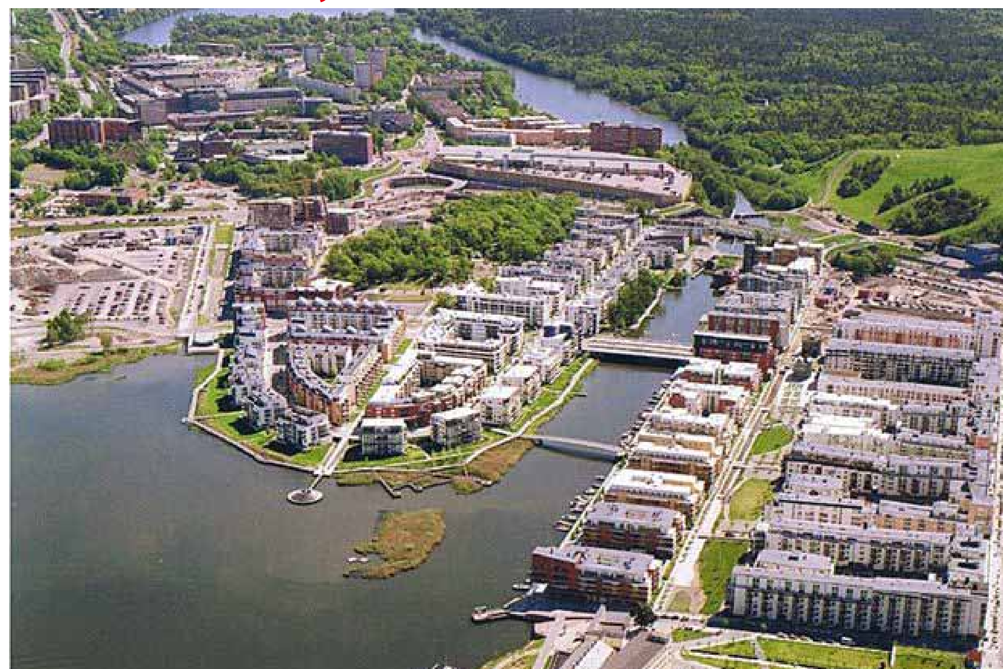
ハンマルビーは水との関りを大切にした、水と緑の住環境がテーマです The theme of Hammarby is an environment of water and greenery; the design especially accentuates its intimate connection with water.