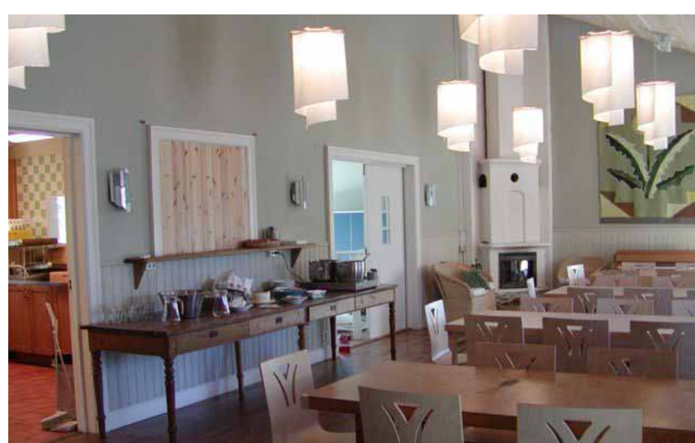
ラウンジは、多目的室、厨房、子供室がある。エコ便器は大小便を区分して排水する The lounge provides a multipurpose room, a kitchen, and children's playroom. The ecological toilet facilities provide dual flush function—full flush and half flush—to conserve water