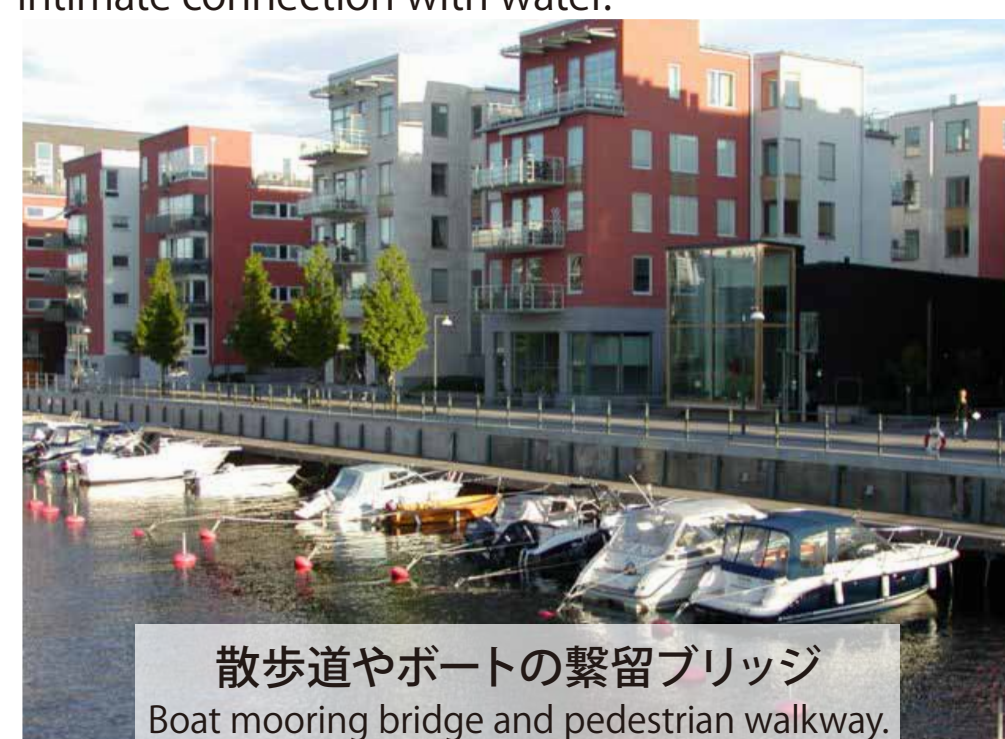
散歩道やボートの繫留ブリッジ Boat mooring bridge and pedestrian walkway.