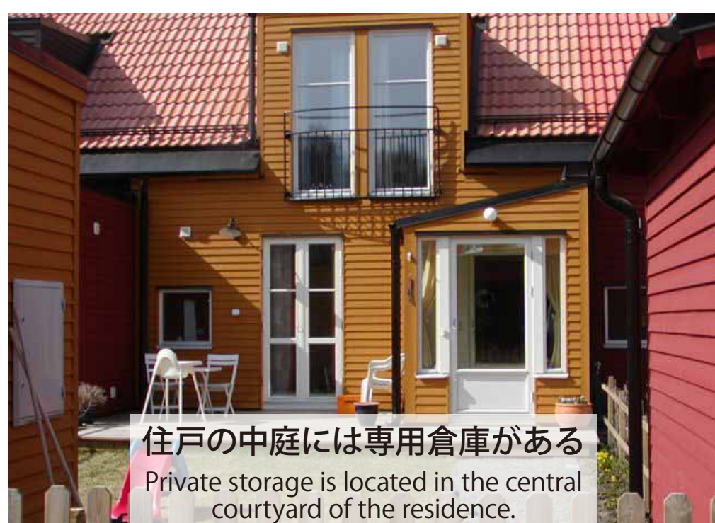
住戸の中庭には専用倉庫がある Private storage is located in the central courtyard of the residence.