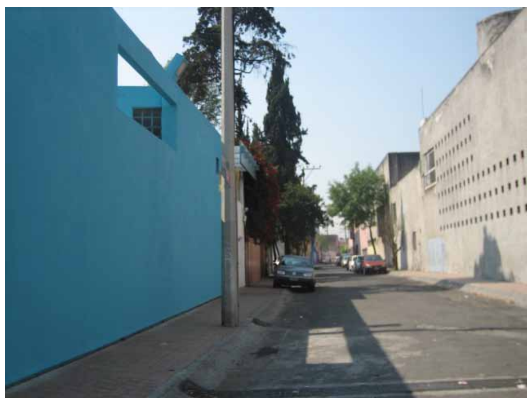
以外にも左側の建物ではなく、右側の建物がバラガン邸 Surprisingly, not the left hand side, but the right-hand side house, is the Barragan House!