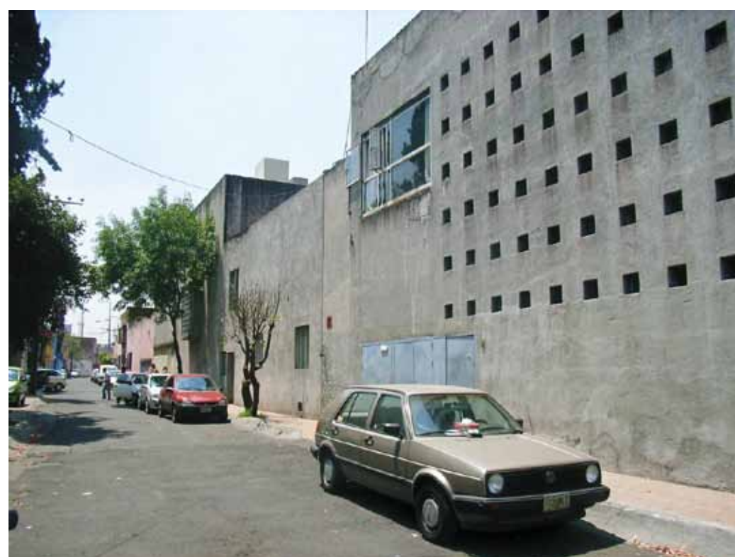
素朴な概観 A rustic exterior