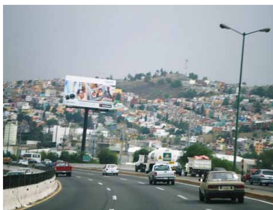
中級・高級住宅地、シウダード・サテリテ (Ciudad Satelite, 「衛星都市」)