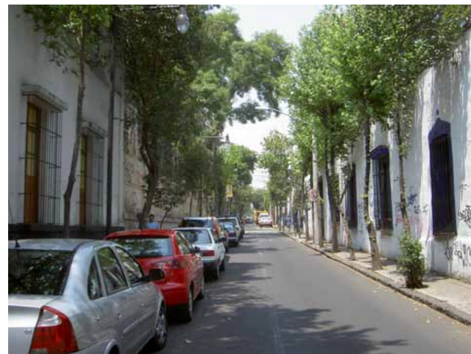
並木道が整備された閑静な地域 A quiet neighborhood with tree-lined streets