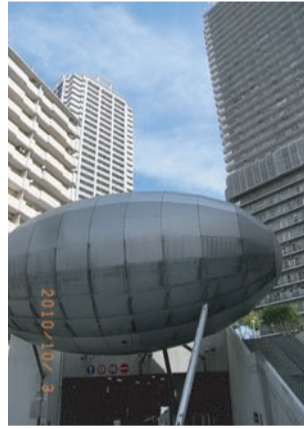
←佃島から大川端リバーシティ 21 を眺める