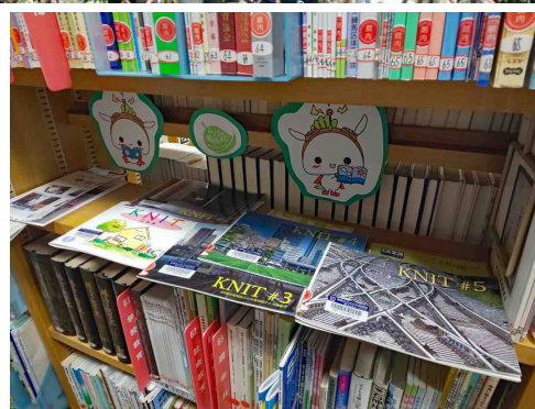
練馬区立光が丘図書館の書架 (練馬区資料コーナー)