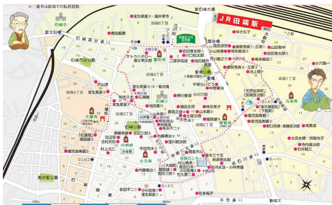
文士村マップ（文士村記念館 発行）