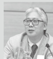
松村 秀一 まつむらしゅういち 東京大学大学院工学系研究科建築学専攻教授

1986年より東京大学工学部建築学科講師 助教授を経て、2006年より現職 ローマ大学、トレント大学、南京大学、大連理工大学 モントリオール大学、ラフバラ大学の客員教授を歴任 2005年 日本建築学会賞(論文) 2008年 都市住宅学会賞(著作) 2015年 日本建築学会著作賞 都市住宅学会賞(著作)