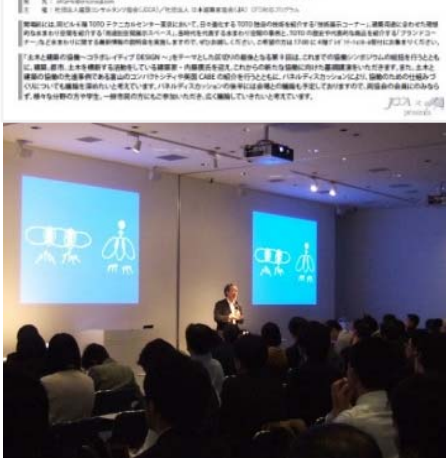
第9回シンポジウムのフライヤー及び内藤廣氏の基調講演の様子