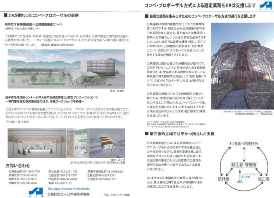
良質な建築・美しい街づくりの仕組み・萌芽事例シートの例