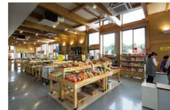
地産地消型店舗（にぎわい処）

JR 松尾駅から至近距離に位置し、公民館、学童クラブ、地産地消型の店舗の3つの機能を持つ複合型の地域交流拠点である。新たな地域コミュニティの核となる施設を計画するため、3年の歳月をかけて市と地域住民が研究会を行って計画された。