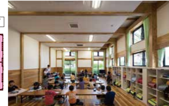
生活室（学童クラブ）