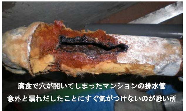
腐食で穴が開いてしまったマンションの排水管 意外と漏れだしたことにすぐ気がつけないのが怖い所