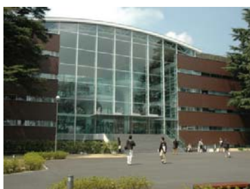
「成蹊大学情報図書館」