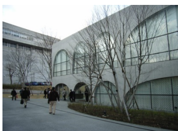
「多摩美術大学図書館」