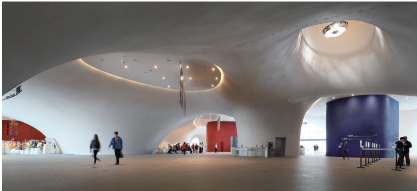
1階ホワイエ

「台中国家歌劇院」は2005年にコンペティションが行われ、11年の歳月を費やして2016年秋にオープンしました。この間さまざまな困難を乗り越え、私達のオフィスにとって忘れ難いプロジェクトとなりました。今回は初期から完成に至るまでのドキュメントを皆様に紹介したいと思います。