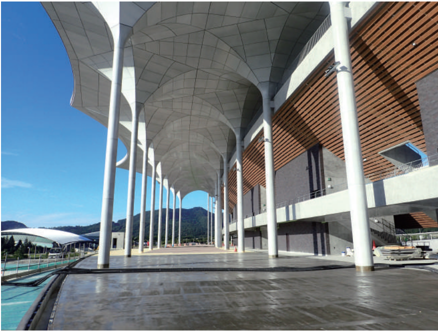
(仮称) 新青森県総合運動公園陸上競技場

我々の仕事の大半はコンペティションから始まっています。思いがけない勝利、予想に反した敗北、悲喜こもごも、コンペティションの記憶は我々自身の最も生々しい建築史です。 前回に続き、2005年頃から最近までの応募作をご紹介します。