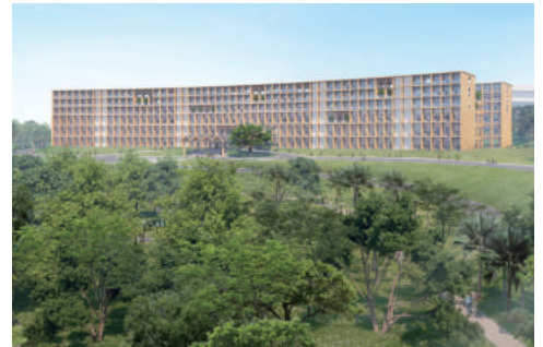
(仮称) 南洋理工大学南校舎棟 c)housecomplex 河原和彦