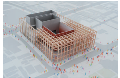
水戸市新市民会館