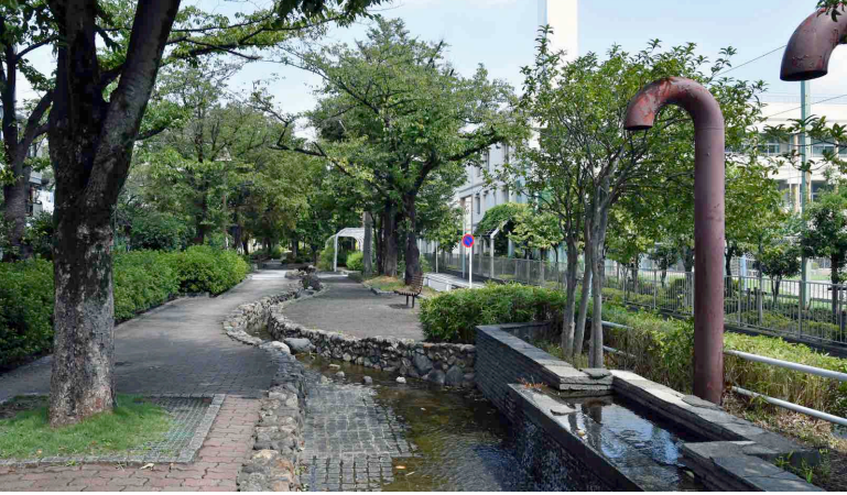
新河岸川合流付近／旧前谷津川にちなんだ親水公園