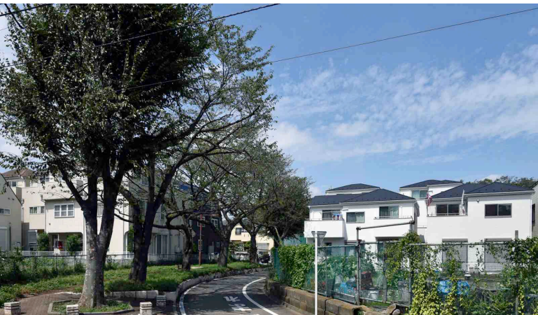
農地と宅地／川の役割が農業用水から生活用水に変わり、農地も宅地となる