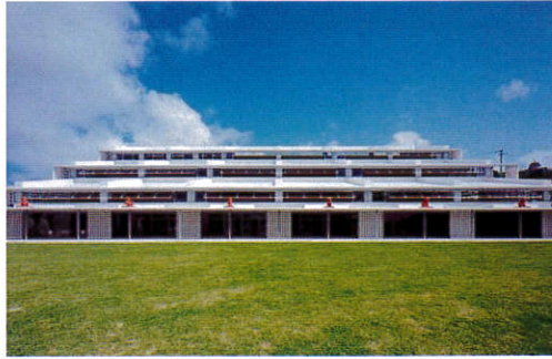
沖縄県看護研修センター 竣工年月日2013年11月