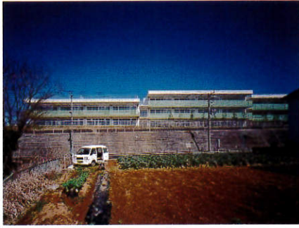
美しが丘西小学校 竣工年月日2013年3月