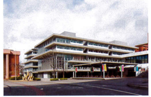
龍谷大学深草キャンパス和顔館 竣工年月日2015年1月