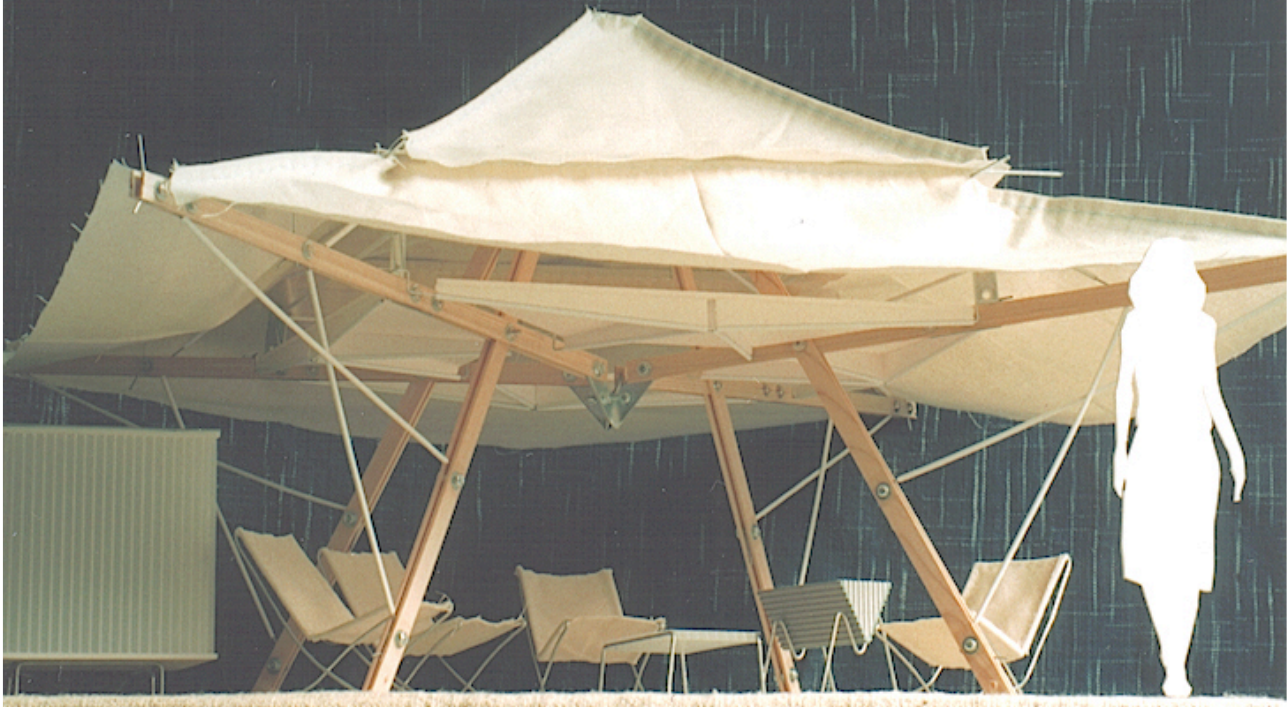
昼間のカフェのイメージ

象の鼻パークには、波打ち際に木陰が少ないので、潮風を感じながら、たたずんだりくつろいだりする拠り所がありません。 ノマディック・ルーフがあれば、丁度良い木陰になり、拠り所になるので、より快適で居心地の良い、楽しい時間になります。 又、簡単な飲食を提供することで、より楽しい居場所になります。 詳細計画は今後検討しますが、以下、基本計画時のイメージです。