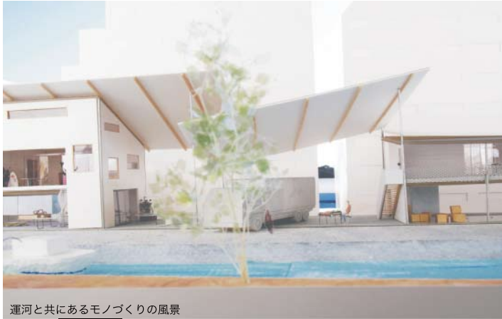
運河と共にあるモノづくりの風景