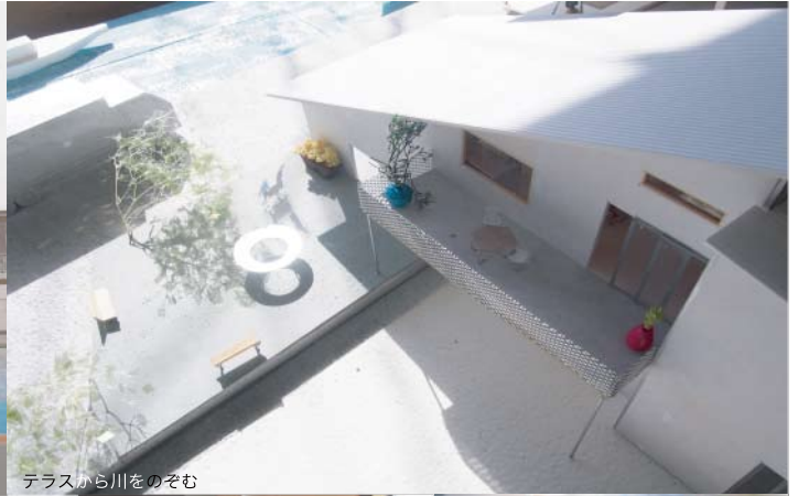
テラスから川をのぞむ