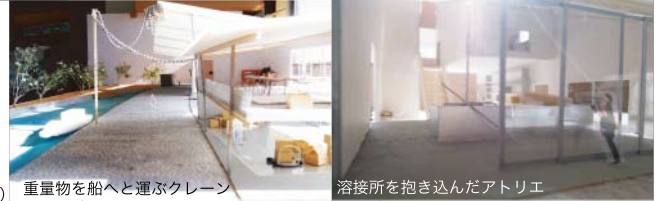
重量物を船へと運ぶクレーン